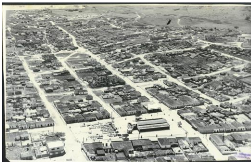
Figura 1: Vista aérea de Itanhém