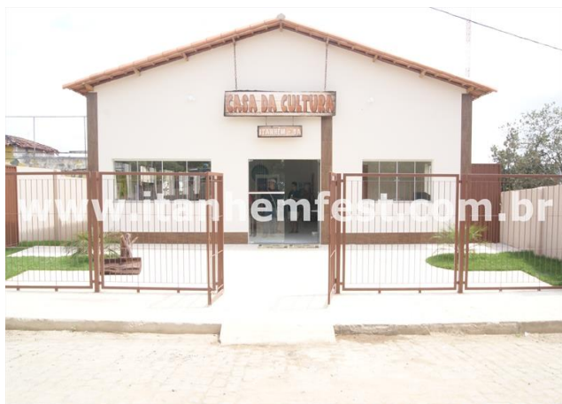
Figuras 8 e 9- Casa da Cultura de Itanhem

A Casa da Cultura de Itanhém, Inaugurada no final de junho 2012, se tornou o endereço certo dos artistas itanheenses e região. O espaço é mais um sonho que, nos últimos anos, transformou-se em realidade , graças à ação da atual administração pelo seu comprometimento com a gente baiana.