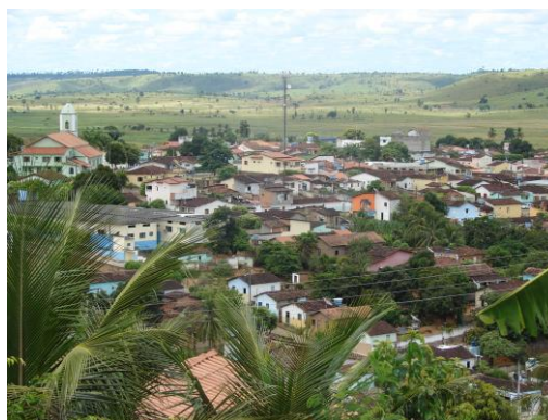
Figura 2: Vista aérea de Itanhém atual

O município de Itanhém-Ba começou o seu povoamento por volta de 1918, por aventureiros procedentes do Estado de Minas Gerais, que se estabeleceram as margens do Rio Itanhém, desenvolvendo a criação de gado, mas vale lembrar que a região era primitivamente habitada pelos índios Machacális.